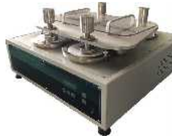
تعیین ثبات مالشی (مارتیندل)