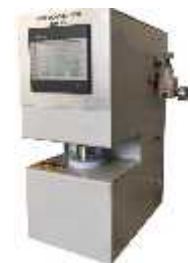
زبری سنج به روش بنتسن