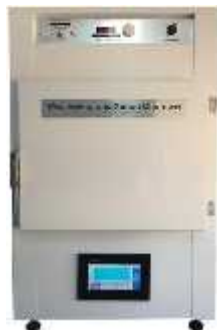
به همراه شرایط جوی