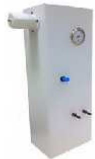
(نفوذ پذیری هوا)