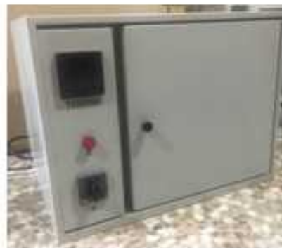
کوره آزمایشگاهی الکتریکی