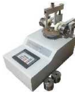
تست سایش ( )