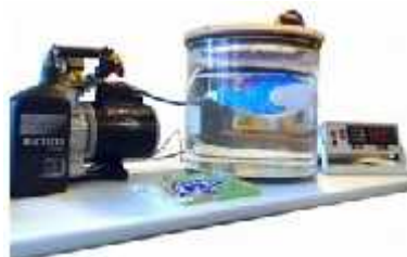
تست نشنی و درزبندی