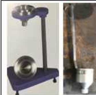
فوردکاپ و کاپ سرپاتیل