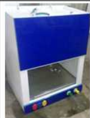
هود آزمایشگاهی رومیزی