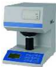
روشنی و سفیدی سنج