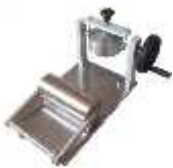
کاب تستر ( )