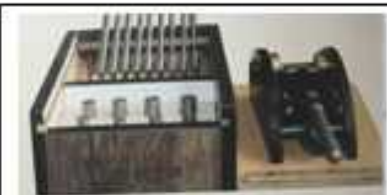
تست خمش (مندرل اهرمی)