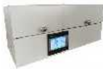
نرمی یا زبری سنج