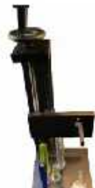
میزان کجی لبه ظروف