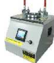
اندازه گیری عبور هوا از کاغذ