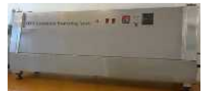
پیرسازی نمونه QUV

فانم قدیانی (تلفن، تلگرام و واتسآپ) ۰۹-۱۲۶۵۱۱۷۶