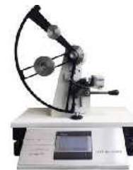
المندورف دیجیتال (تست پارگی)