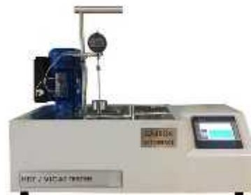
نقطه نرمی HDT/VICAT