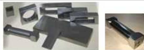
انواع اپلیکاتور (فيلم کش رنگ)