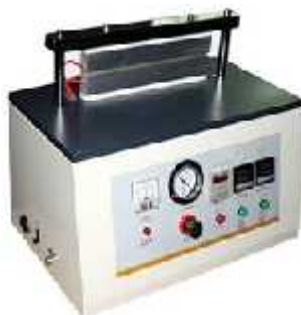
دوخت فیلم HST