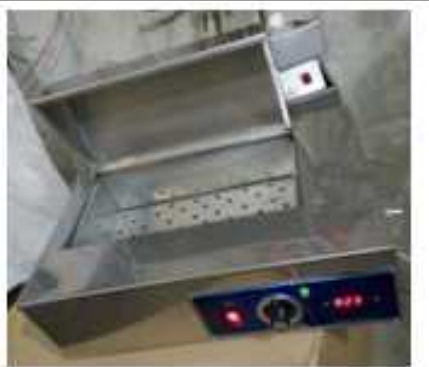
بن ماری سرلوژی