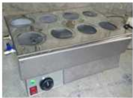
بن ماری جوش