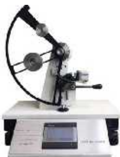
تست پارگی المندورف