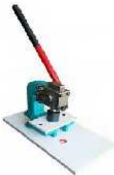
پانچ دستی نمونه سازی