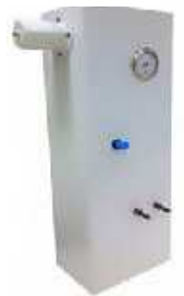
تعیین نفوذپذیری هوا ( )