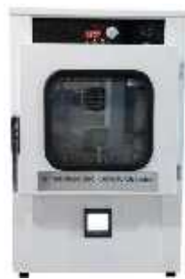
تست شرایط محیطی