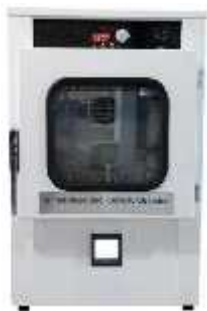
تست شرایط محیطی ( )