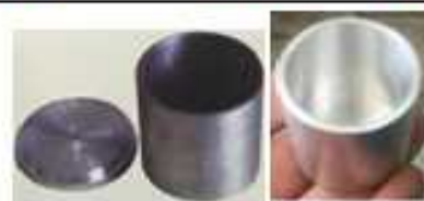
پیکنومتر (دانسینه متر)