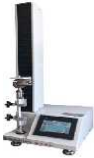
یونیورسال کشش فشار خمش