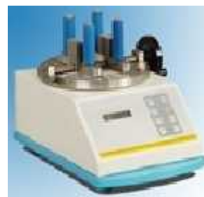
ترکمتر ( )