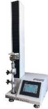
یونیورسال کشش فشار خمش