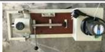
تست خراش رنگ