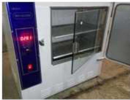
اینکوباتور ساده و یخچالدار