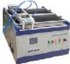
تست شستشوی کاغذ دیواری