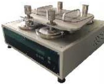
تعیین ثابت مالشی (مارتیندل)