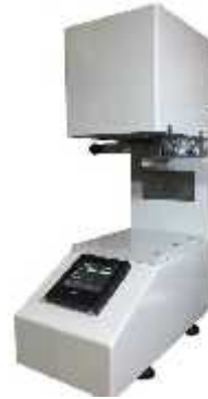
MFI نقطه ذوب