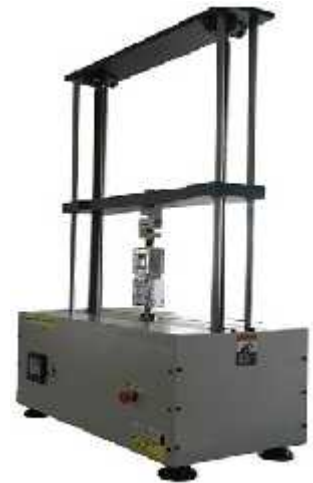
یونیورسال ام دی اف