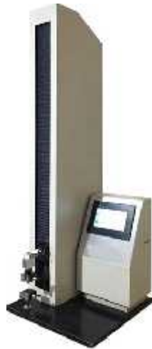
استحکام کششی کیلوگرم نمونه های سلولزی