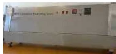
پیرسازی نمونه QUV