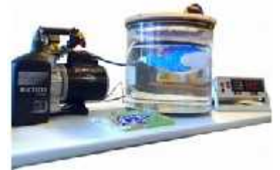
تست نشتی و درزبندی