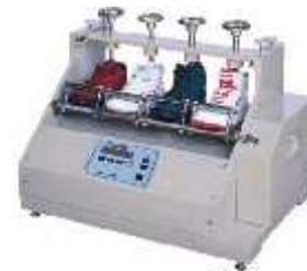
تست خمش کفش (تست قدم زنی)

فانم قدیانی (تلفن: تلگرام و واتساپ ۰۹۰۱۲۶۵۱۱۷۶)