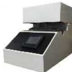
نرمی سنج دستمال کاغذی