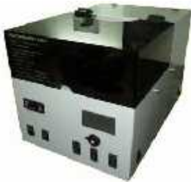
نفوذپذیری اکسیژن GTR