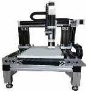
نمونه ساز CNC