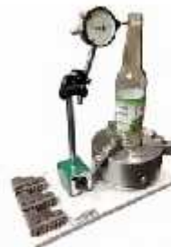
انحراف سنج بطری

فانم قدیانی (تلفن، تلگرام و واتس‌آپ ۰۹۰۱۲۶۵۱۱۷۶)