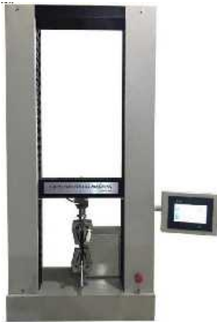
یونیورسال کشش فشار خمش