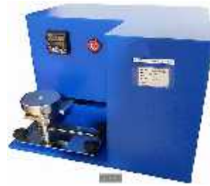
تعیین ثابت مالشی Crack meter