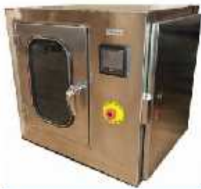
فشار داخلی بطری