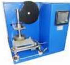
تعیین ضخامت تحت فشار بار متحرک