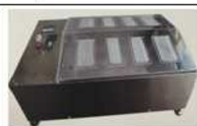
دستگاه تست رطوبت رنگ