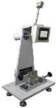
تست ضربه آیزود چارپی