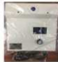
براقیت سنج (گلاس میتر)