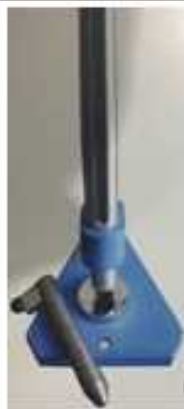
تست ضربه (ایمپکت)