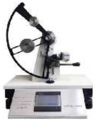
المندورف دیجیتال ( پارگی )