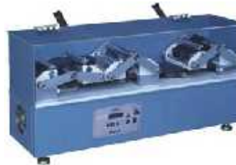
تست قدم زنی زیره کفش