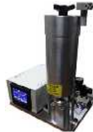
نفوذپذیری هوا به روش گرلی