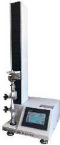
یونیورسال رومیزی کیلوگرم

دستگاههای کشش یونیورسال در ظرفیت های مختلف :