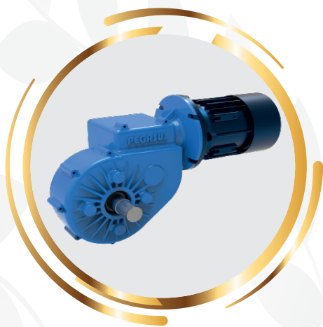
گیربکس گاهنده دور هوشمند