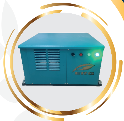
دستگاه رطوبت گیر هوشمند